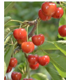
【紅秀峰】 6月末~7月10日頃

さくらんぼといえばこれ。果肉は乳白色で粒が大きく、ハリがありつつ、やわらかい食感。酸味と甘みのバランスが◎!