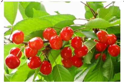
【佐藤錦】 6月20日~7月5日頃

さくらんぼ狩りに行こう! 庄内のさくらんぼ園では、様々な品種を楽しむ園が多いのが魅力です。また、もう一足のぼして庄内観光を手軽に楽しんでほしいという気持ちもこめて、このパンフレットには、庄内地域の主な観光施設も掲載しています。