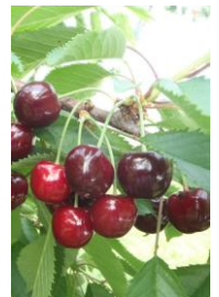
【紅さやか】 6月10日~20日頃

最近人気の品種。粒が大きく、果肉はパリッと硬めで日持ちも◎。佐藤錦のあとに収穫時期が来る、晩生の品種です。