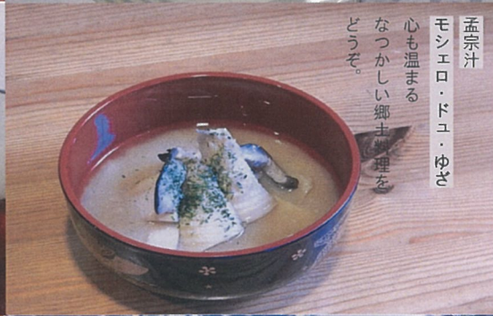
孟宗汁 モシエロ・ドユ・ゆざ 心も温まる なつかしい郷土料理を どうぞ。