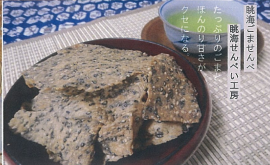
眺海こませんべ 眺海せんべい工房 たっぷりのごま ほんのり甘さが クセになる。