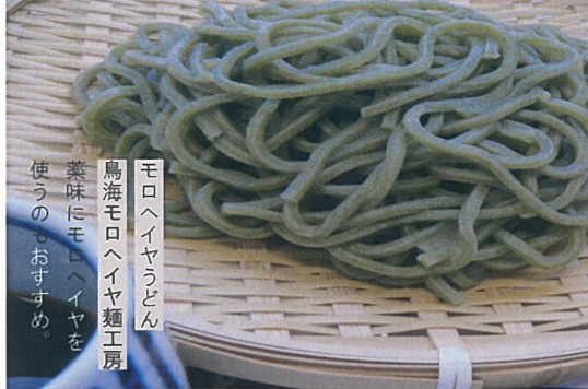
モロヘイヤうどん 鳥海モロヘイヤ麵工房 薬味にモロヘイヤを 使うのもおすすめ。