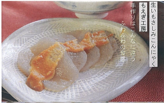
生いもさしみこんにやく もえぎ工房 手作りはこんなに違う ふわふわの食感