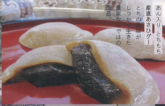
あん入りもちもち 産直あさひケー とちの風味が しつかり生きた 農家ならではの 逸品。