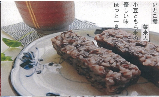
いとこ煮 菜来人 小豆ともち米の 優しい味 ほっと一息