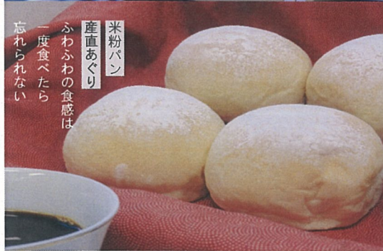
米粉パン 産直あぐり ふわふわの食感は 一度食べたら 忘れられない