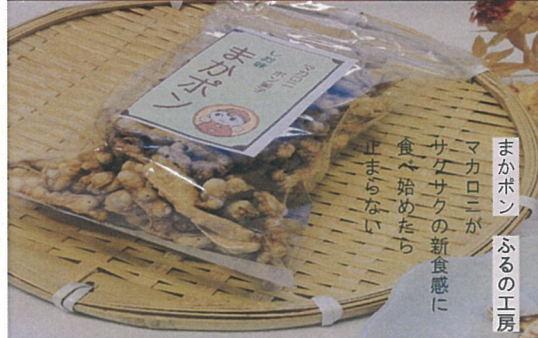
まかポンふるの工房 マカロニが サクサクの新食感に 食べ始めたら 止まらない