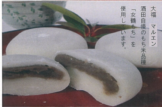
大福 マルエン 酒田自慢のもち米品種 「女鶴もち」を 使用しています。