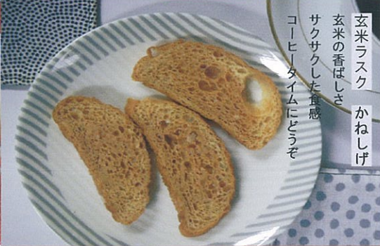
玄米ラスク かねしげ 玄米の香ばしさ サクサクした食感 コーヒータイムにどうぞ