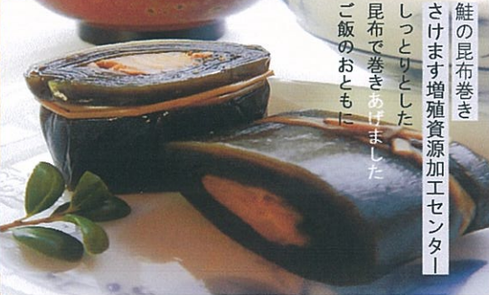
鮭の昆布巻き さけます増殖資源加工センター しっとりとした 昆布で巻きあげました ご飯のおともに