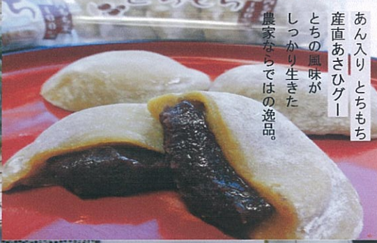
あん入りとちもち 産直あさひゲー とちの風味が しっかり生きた 農家ならではの逸品。