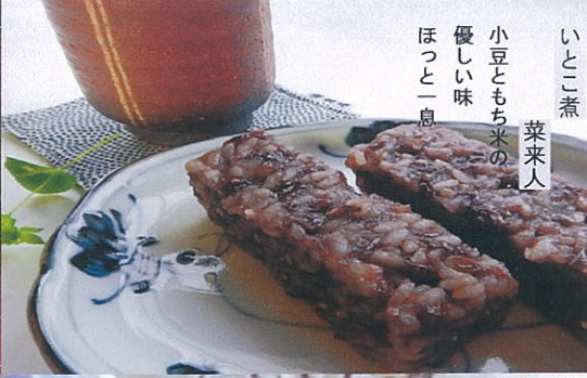
いとこ煮 菜来人 小豆ともち米の 優しい味 ほっと一息