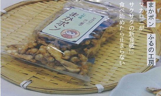
まかポン ふるの工房 マカロニが サクサクの新食感に 食べ始めたら止まらない