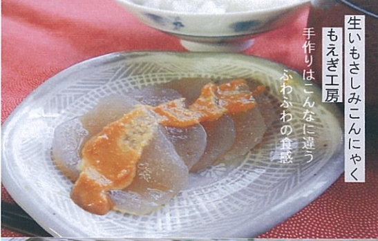
生いもさしみこんにやく もえぎ工房 手作りは、こんなに違う ふわふわの食感