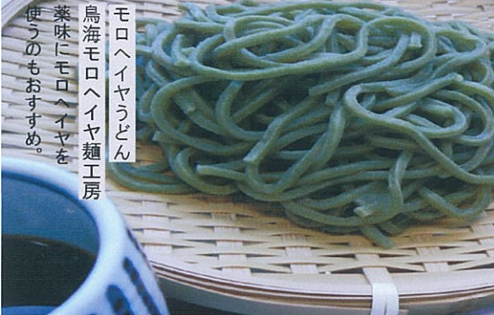
モロヘイヤうどん 鳥海モロヘイヤ麺工房 薬味にモロヘイヤを 使うのもおススメ