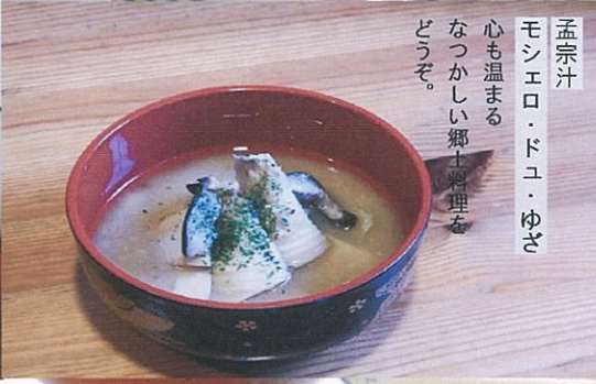
孟宗汁 モンエロ・ドユ・ゆざ 心も温まる なつかしい郷土料理を どうぞ。