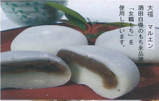
大福 マルエン 酒田自慢のもち米品種 「女鶴もち」を 使用しています。