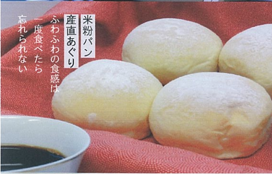
米粉パン 産直あぐり ふわふわの食感は 一度食べたら 忘れられない