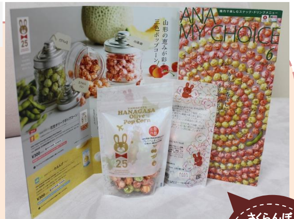
↑国内線機内で販売する、「ANAオリジナルパッケージ」