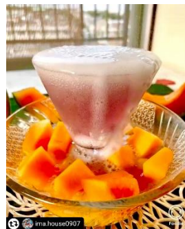
鶴姫レッドで 紫噴水フルーツポンチ