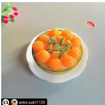
メロンでレアチーズケーキ