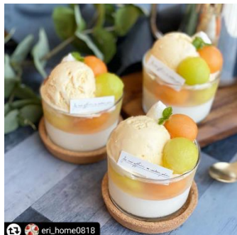
パナコッタ&メロンゼリー