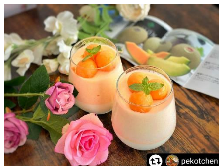
庄内砂丘メロン 鶴姫レッドのババロア