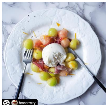
メロンと桃、ブッラータのサラダ