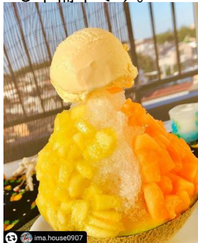
庄内砂丘メロンを使った 贅沢かき氷 夏の陣

「庄内砂丘メロン」をPRしていただく「庄内砂丘メロンアンバサダー」6名による投稿です