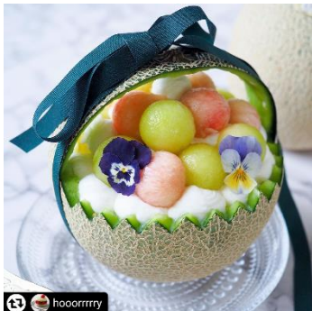
メロンと桃のバスケットケーキ